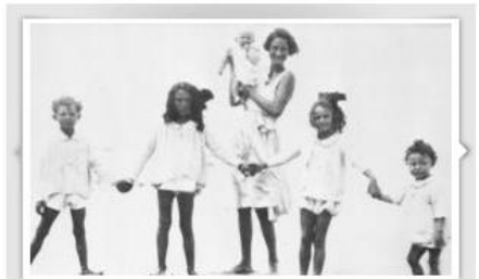
Gli Agnelli: Dynasty italiana